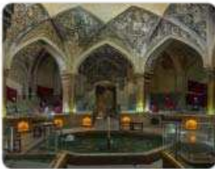
حمام و کیل - شیراز

در دوره استقرار کریم‌خان زند در شیراز اقدامات قابل توجهی انجام شد. مدارا و احترام کریم‌خان زند نسبت به هنرمندان و علما موجب رونق هنر و معماری در زمان او شد. اقدامات عمرانی کریم‌خان در شیراز: ساخت مجموعه مسجد و بازار و حمام و کیل، ارگ کریم‌خانی و بازسازی آرامگاه‌های حافظ و سعدی و باغ دلگشا ساخت بناهایی با عنوان «کلاه فرنگی» که نوعی بنا با کاربرد تفریحی و بنایی کوچک و تزئینی بود که در وسط باغ‌ها یا تفریحگاه‌ها ساخته می‌شد.