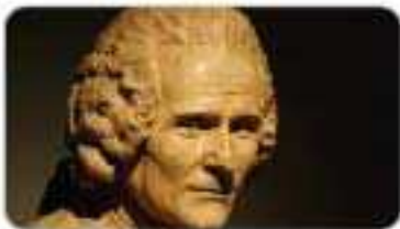
نگاره ژان ژاک روسو (۱۷۱۲ - ۱۷۷۸ م)

نکته: در کنار این عوامل، تحولات فکری جامعه فرانسه نیز نقش بزرگی در پیدایش انقلاب داشت که تحت تأثیر عصر روشنگری اروپا، فلاسفه و روشنفکرانی ظهور کردند که اندیشه‌های آنان مردم را به سوی انقلاب رهنمون ساخت و به اصحاب دایرةالمعارف مشهور بودند.