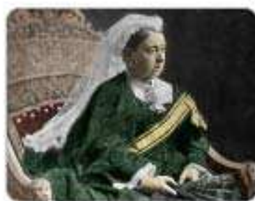
ملکه ویکتوریا (۱۸۱۹ - ۱۹۰۱ م)

جورج واشنگتن به‌عنوان نخستین رئیس‌جمهور این کشور انتخاب شد. (۱۷۸۹م)