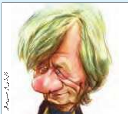
کاریکاتور از حسین صافی

حتماً شما کاریکاتورهای زیادی از اشخاص مختلف دیده‌اید. تفاوت کاریکاتور با تصویر واقعی اشخاص این است که در کاریکاتور، بین اعضای بدن شخص تناسب وجود ندارد. عضوی بسیار کوچک طراحی می‌شود و عضوی بیش از اندازه بزرگ و همین قیافه ناموزون موجب خنده بیننده می‌شود.